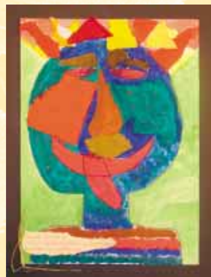
Nosatec travnatý: Žije ve vysoké trávě, žíví se jedovatými houbami, a proto je tečkovaný. Jaroslav Forejt, IV. třída