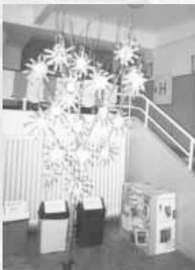
Sluníčka 1. B rozzářily celý strom už v březnu.

Škola Raškovice zařazuje projekt do výuky a mimoškolních činností již pátým rokem. Pracuje na něm celá škola, tj 400 žáků 1.–9. ročníku. Letní učebna, kterou pro ZŠ Raškovice postavily Lesy ČR – Lesní správa Frýdek Místek se sídlem na Morávce, se stala místem mnoha zajímavých výstav, jako např. Barvy a vůně podzimu, Příroda v zimě apod. Hlavní téma strom prolínalo veškerou výukou, tedy nejenom volitelný předmět přírodovědná praktika, ale i výtvarnou a občanskou výchovu, výuku jazyků a pracovní činnosti. Jednotlivé třídy se představují prostřednictvím „třídního stromu“, který stojí na chodbě v přízemí školy.