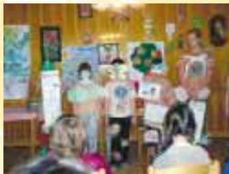
ZŠ Mandysova, Hradec Králové představuje svůj projekt