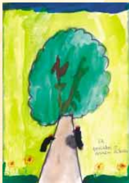
Ilustrace k povídce o lesním lékaři. Tereza Mácalová

Účastníky projektu v Luhačovicích jsou žáci nepovinného předmětu biologická praktika. Společně pracují na různých úkolech z pracovních listů, chodí do přírody apod. Významnou akcí bylo uspořádání Dne ptactva, do kterého se zapojili učitelé, rodiče, prarodiče, LS Luhačovice, místní tisk a dalších asi 250 žáků školy. Výtvarné nadání luhačovic- kých žáků se nesporně projevilo při určování stáří stromů podle letokruhů, kdy podle jejich nákresů vymodelovali pářez z keramické hlíny.