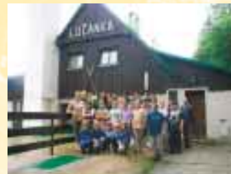
Závěrečné společné foto

LES VE ŠKOLE – ŠKOLA V LESE, inspirace od účastníků projektu v roce 2003/2004.