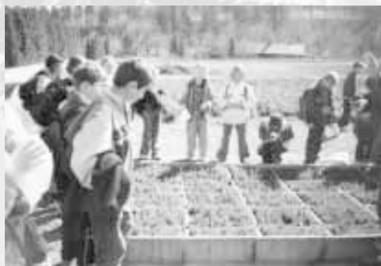
Žáci 4. třídy na návštěvě v lesní školce

Lesní školka, žáci 6. ročníku ZŠ Raškovice