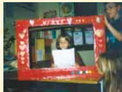
Vysílání televize Srdíčko

Projekt se v Holubově věnovali hlavně ve školní družině, kterou navštěvuje průměrně 20 žáků 1.–4. ročníku. Jejich zprávu tvoří šest leporel, které představují některé z činností jako např. Stromová slavnost, Svátek zvířat, Pátrání po Ferdovi, Dě-