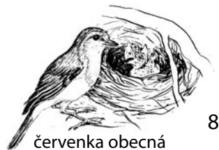
červenka obecná 8