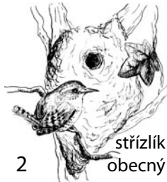
2 střízlík obecný