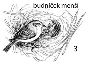
budníček menší 3