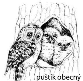
puštíček obecný 6