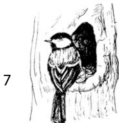
7 sýkora koňadra