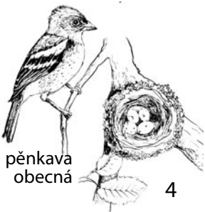
pěnkava obecná 4